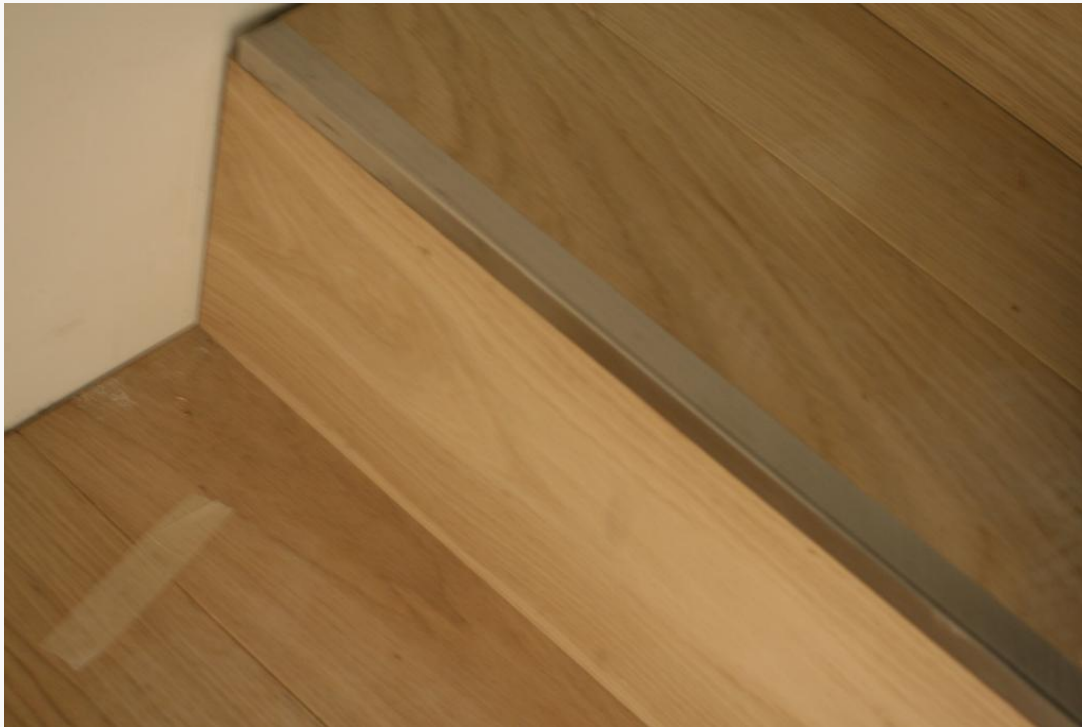
Particolari del rivestimento della scala